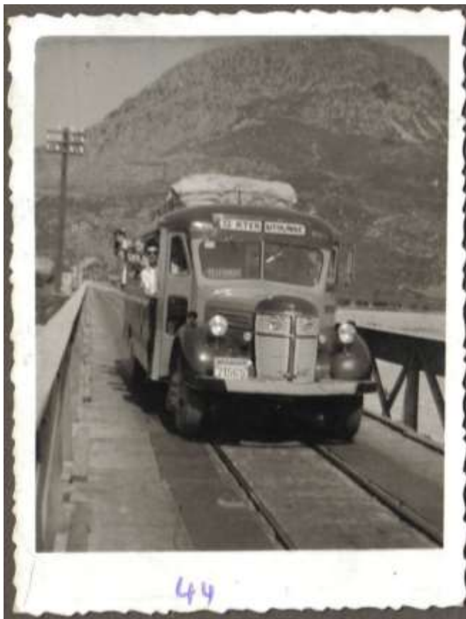
2) Μεικτή χρήση της γέφυρας ως οδικής και σιδηροδρομικής στις αρχές της δεκαετίας του 1960