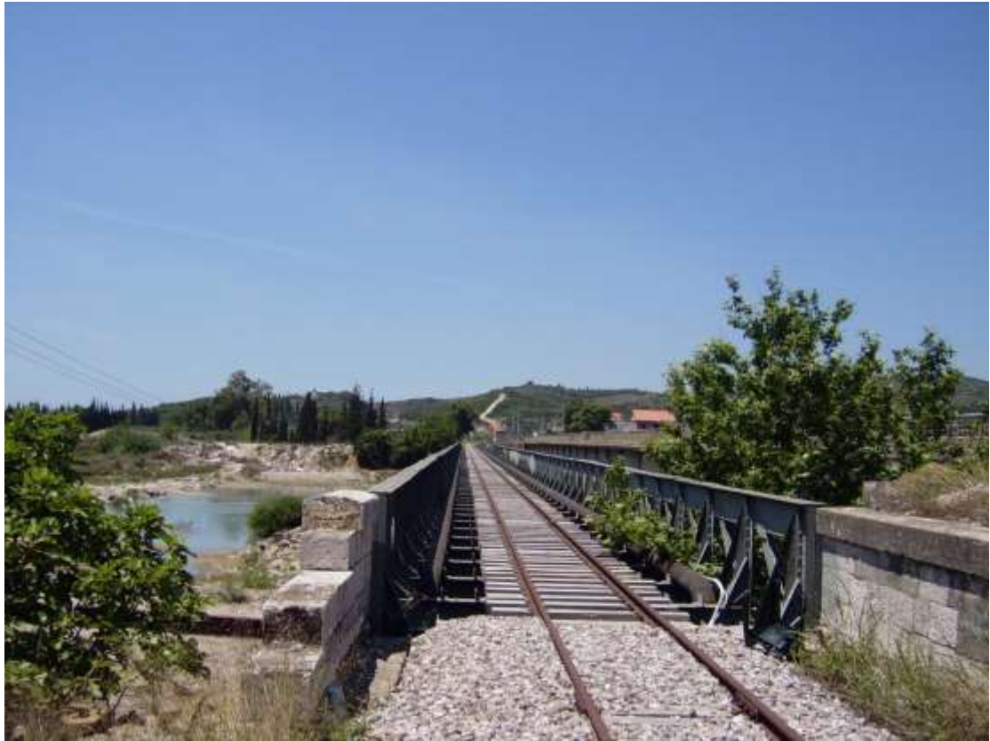
5) Η γέφυρα το 2007