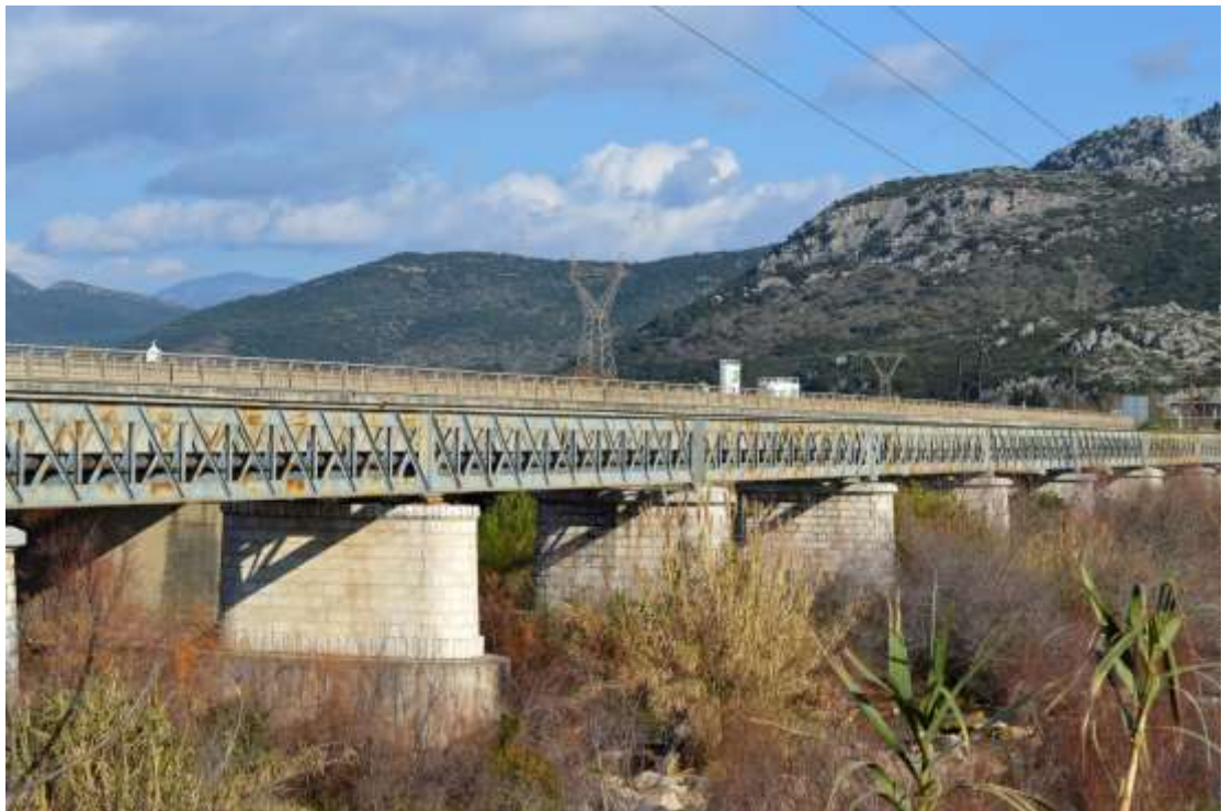
6) Άποψη της γέφυρας το 2014