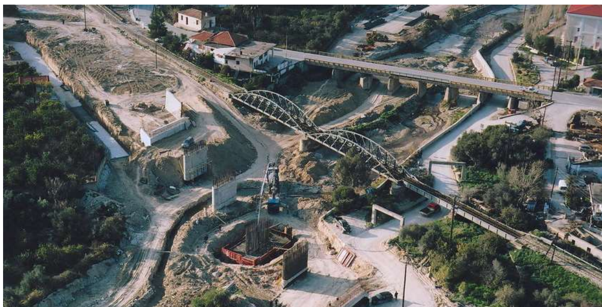
11) Η γέφυρα του Σύθα στο Ξυλόκαστρο σε αεροφωτογραφία περί τα μέσα της προηγούμενης δεκαετίας.