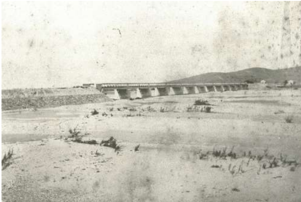
1) Η γέφυρα προ του 1965