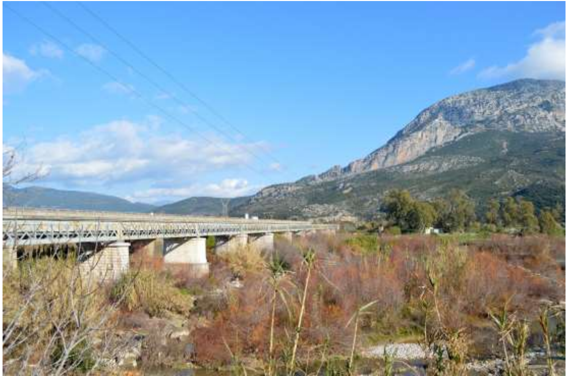
6) Άποψη της σιδηροδρομικής γέφυρας του Ευήνου το 2014