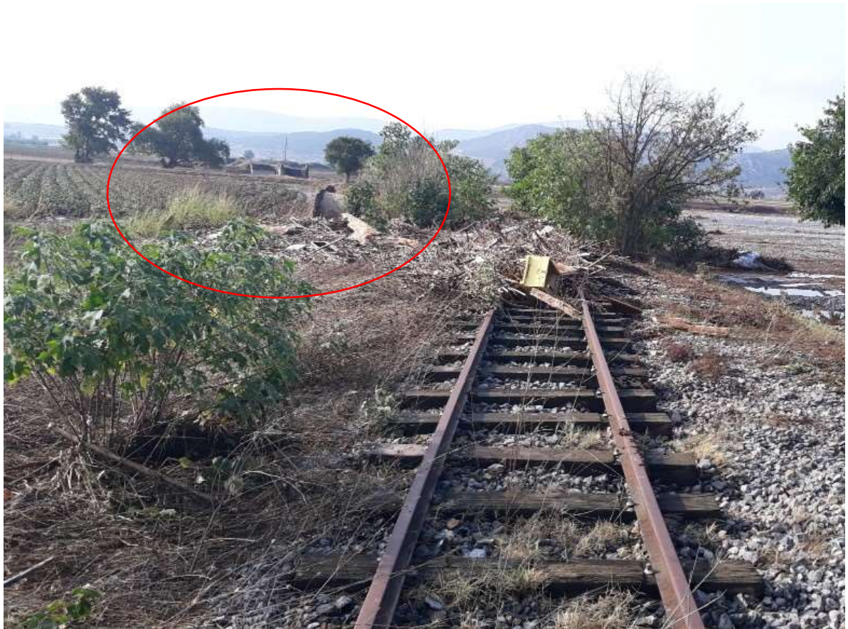
8 & 9 Τα απομεινάρια της γέφυρας του Ενιπέα το 2020, μετά το πέρασμα του Ιανού