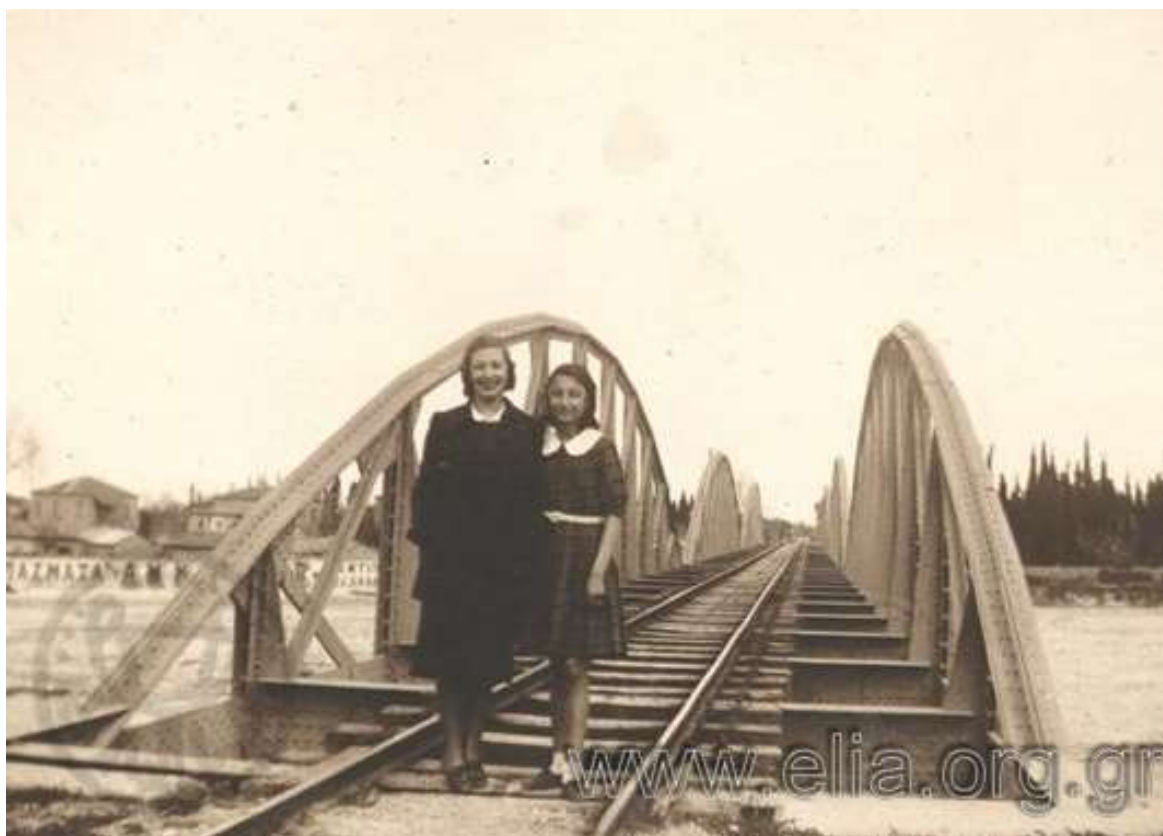
10) Η γέφυρα του Σύθα στο Ξυλόκαστρο προ του Β΄ Π. Πολέμου