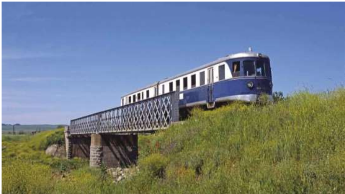
7) Η Γέφυρα του Ενιπέα στη Θεσσαλία με εκδρομικό μουσειακό Συρμό Linker Hofmann στις αρχές της δεκαετίας του 2000. (Φώτης Λυκομήτρος)